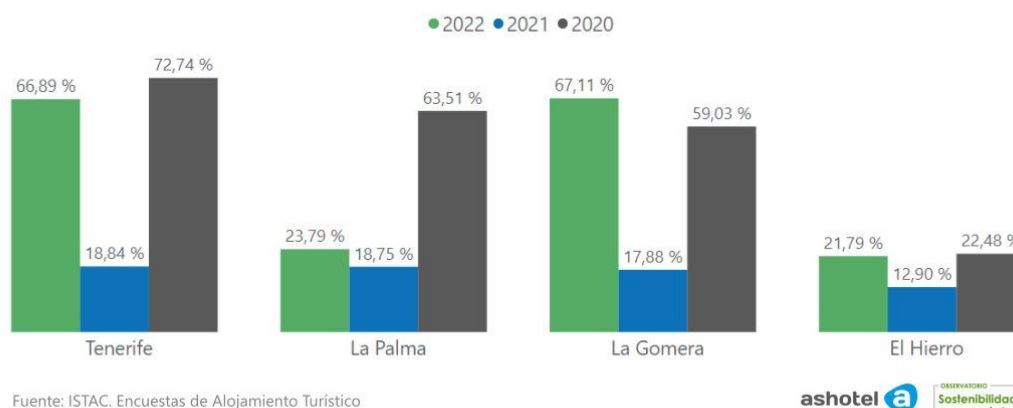
Tasa de ocupación por plazas febrero por islas

En cuanto a las tasas medias de ocupación por plazas, solo La Gomera mejora respecto a febrero de 2020, al registrar el mes pasado una media del 67% frente al 59% de 2020. El resto de las islas aún no alcanza los porcentajes medios de febrero de 2020, pero obviamente mejora cuantitativamente los de 2021. La Palma (23%) y El Hierro (21%) fueron las de menor ocupación el mes pasado, mientras que la media de Tenerife se situó en el 66,9%.