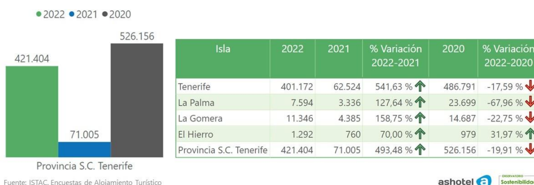
Viajeros alojados febrero provincia de Santa Cruz de Tenerife

mismo mes de 2020. Mientras tanto, La Palma volvió a ser en este indicador la isla que peores cifras registró con respecto a febrero 2020 (-67,9%), aunque supera en un 127% los datos de febrero de 2021. La isla con mejor comportamiento en este indicador con respecto al año pasado fue Tenerife, que alojó a más de 401.000 viajeros en establecimientos hoteleros y extrahoteleros, un 541% más que el mismo mes de 2021, pero un -17,6% que el de 2020. Por último, La Gomera experimentó una mejora del 158%, al alojar a más de 11.300 viajeros el pasado febrero y El Hierro lo hizo un 70% respecto a 2021.