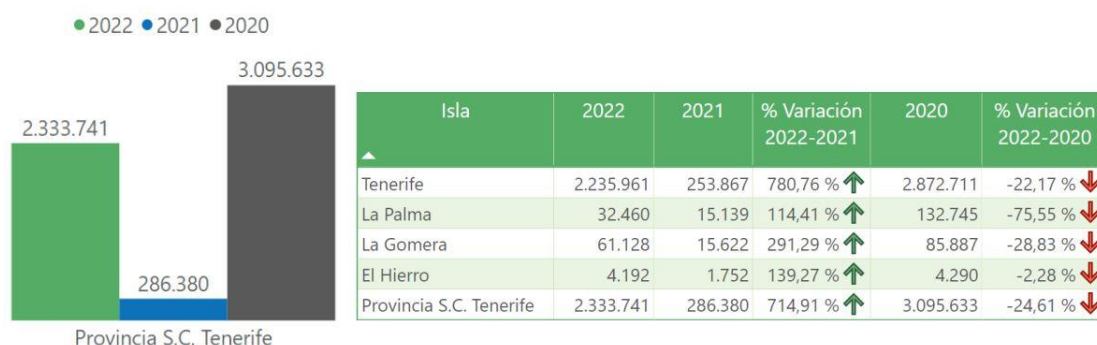
Pernoctaciones febrero provincia de Santa Cruz de Tenerife